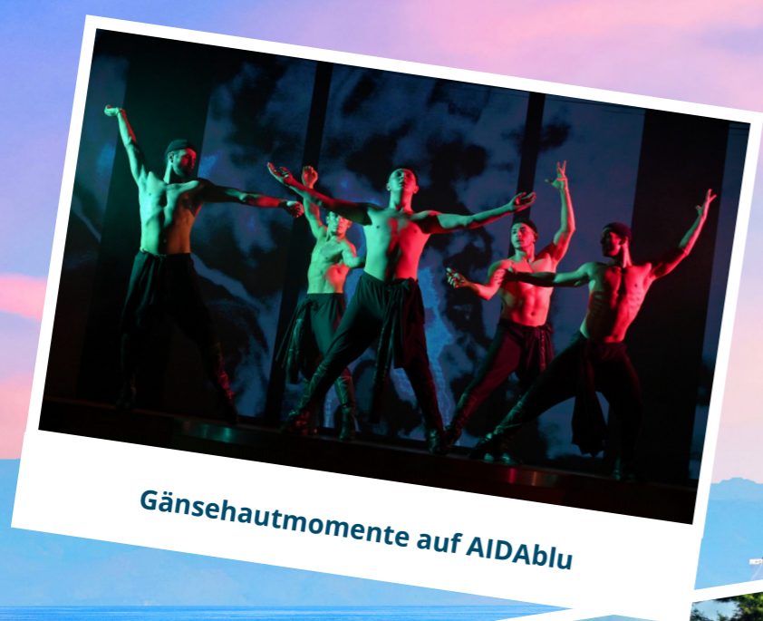
Gänsehautmomente auf AIDAblu