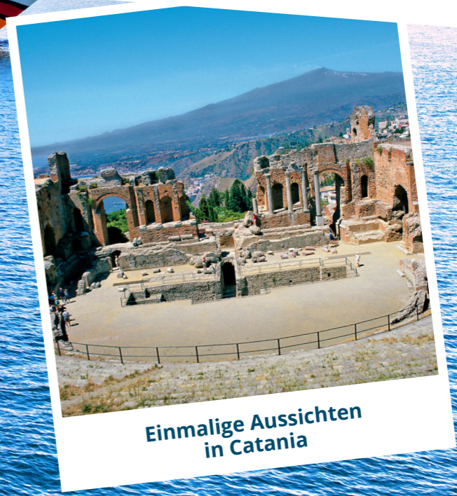
Einmalige Aussichten in Catania