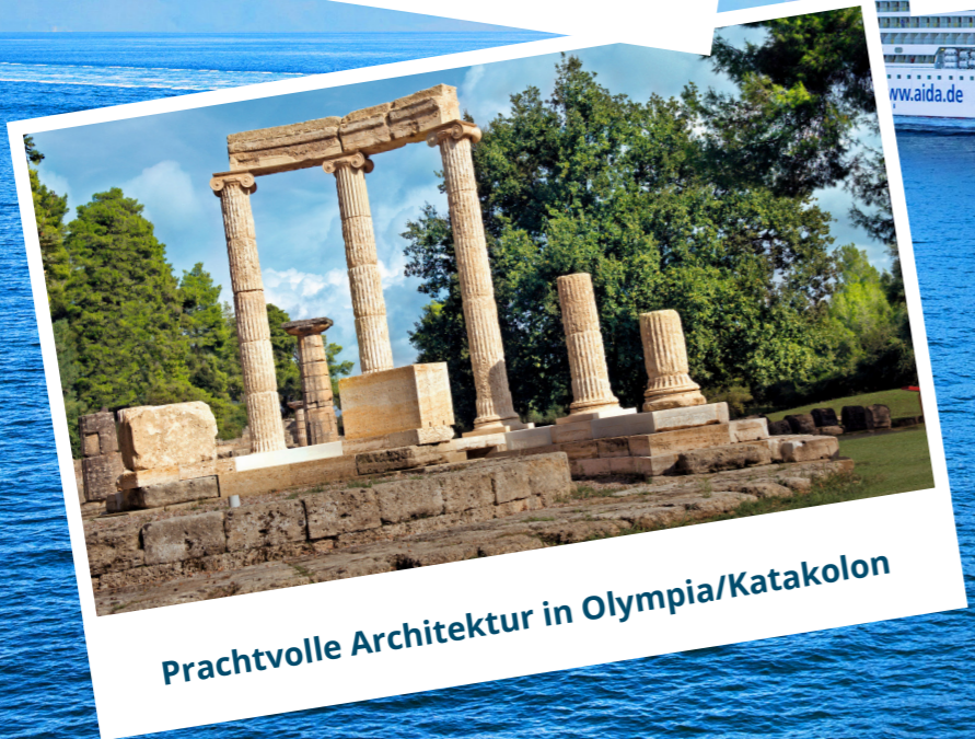
Prachtvolle Architektur in Olympia/Katakolon