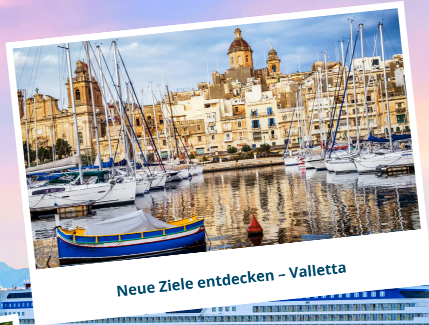
Neue Ziele entdecken - Valletta